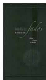
Coleção “ Todos os fados ”