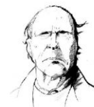
Eugénio de Andrade

Flores, pês, laranjas, Mangas, uvas, figos, Maçãs, melões, melancias, O mistic de meus sentimentos, Para delícia de língua, Deixe-me agora falar Do fruto que me fascina, Para saber, para ver, Para sentir das coisas: Tangerina, tangerina